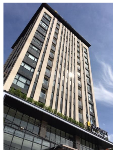
「グランフェルテプノンペン」外観