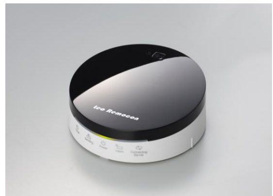
Leo Remocon 本体