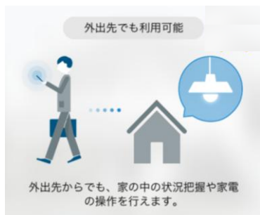
外出先からの操作機能