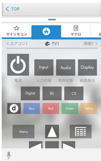
リモコン操作画面

『Leo Remocon』はレオパレス21に標準で備え付けられている家電はもちろん、入居者様がお持ちの赤外線リモコン対応家電をスマートフォンから遠隔で操作や、室内の温度・湿度・明るさの情報を表示できるようにする機器です。入居者様が手軽にスマートハウスを体験できるよう、『Leo Remocon』では、入居者様に専用アプリを提供し、Life Stick(レオネット)対応等の独自機能をご利用いただけます。