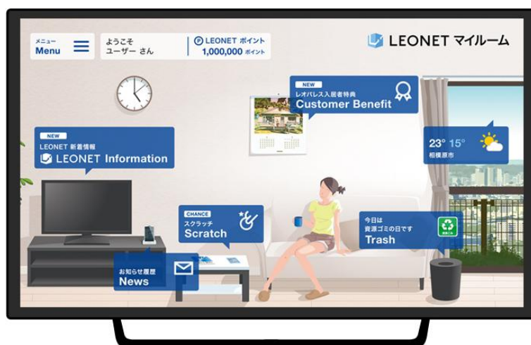
LEONET マイルーム(イメージ)

機能拡充の背景として、スマートデバイスの普及による消費者のライフスタイルの多様化に合わせ、オープンプラットフォームによる拡張性が必要だと考えました。そこで、“あるとうれしいモノ、コト、すべてをあなたの部屋に”というコンセプトのもと、新しく開発した Android TV 対応の STB デバイス「Life Stick」を全国約 56 万戸のレオパレス21物件に標準設備として順次導入し、普段の生活をサポートする「LEONET マイルーム」や、エンタメで生活を豊かにする「LEONET TV」を提供するほか、様々なジャンルの事業者様と提携したパートナーコンテンツの提供も予定しております。