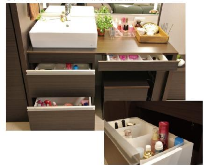
引き出しタイプの洗面化粧台

「ながら美容」の視点を盛り込んだレイアウト。お部屋も広く感じられるようになりました。