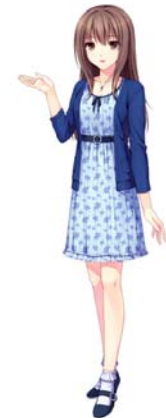
コンシェルジュサービス キャラクター

また、同アプリ内でコンシェルジュサービスとして、キャラクターを設定。会話ボットが皆様の質問に自動的にお答えし、ご入居者の疑問をスムーズに解決します。また、新しいキャラクターの名前も募集し、最優秀者にはロボット型掃除機や、サイン入りのクリアファイルなどの商品が当たります。