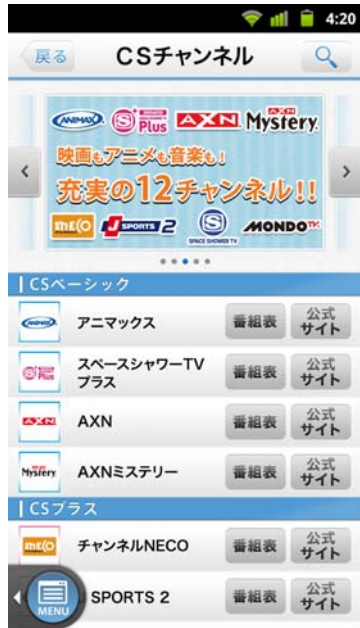
C S 番組情報の確認画面