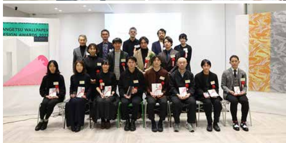
「第5回 サンゲツ壁紙デザインアワード」の様子

「サンゲツ壁紙デザインアワード」は、ブランド理念『Joy of Design』※をテーマとして、2017年から毎年開催しているデザインコンペティションです。当社は、本アワードを通して、新たなデザインの創出や若手デザイナーの発掘に取り組み、インテリア文化の向上に貢献することを目指しています。