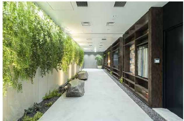
エントランスへのアプローチ

オフィスの中央にはグリーンルーフのある「やぐら」スペースをつくり、社員の偶発的な出会いやコミュニケーションが生まれる場としました。