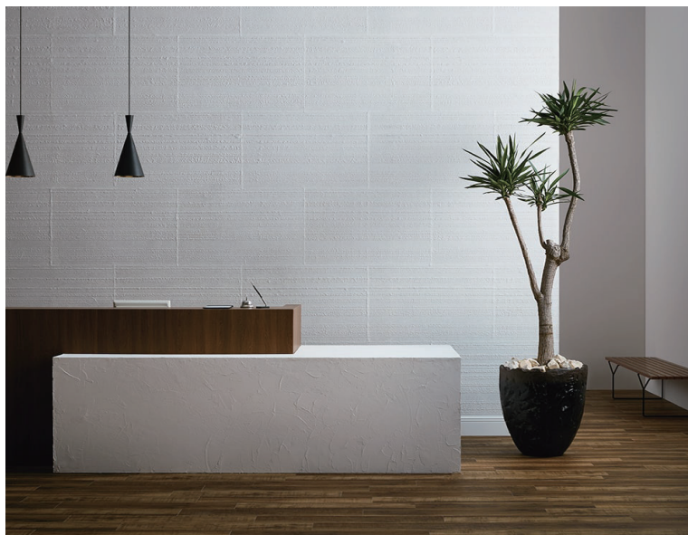
施工例 SGB2031 越前和紙 落水の技法によって生まれるモダンなストライプ柄の手漉き和紙

日本の伝統技術と美意識を取り入れた商品や、世界の流行をけん引するグローバルブランド、そして多彩なマテリアルを使用したアイテムなど、こだわりの空間を演出する壁装材を厳選。新しい発想が生み出すクリエイティビティと素材の特性を活かした商品を多数収録しています。新鮮な発見とワンランク上のインテリア空間を創造する、最新のコレクションをご提案します。