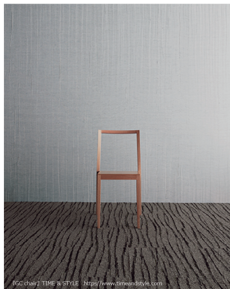
もわもわ [壁紙: SGB2010]