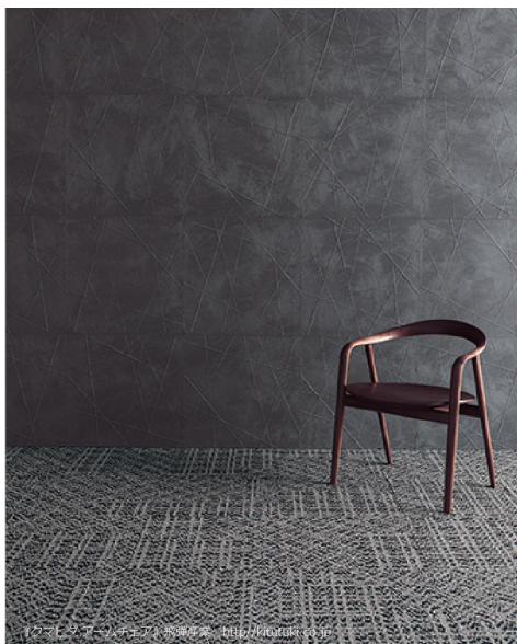
しゅらしゅら [壁紙: SGB2003]

屹立するつぶたちの表現力 「カゲ」の中をつぶつぶ。その不均一さや凹凸感のバランスを追求することで、「カゲ」が本来生みだしている力強さや温かみを表現しました。