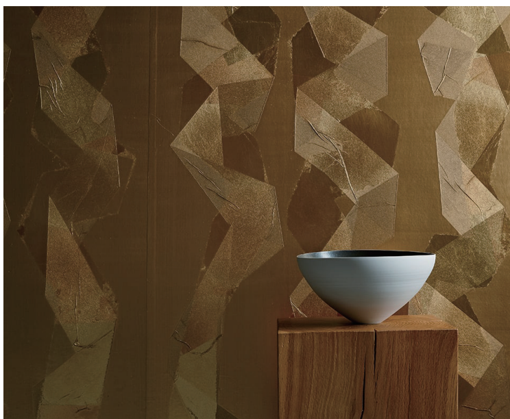
施工例 SGB2107（紗袷せ流し貼り）