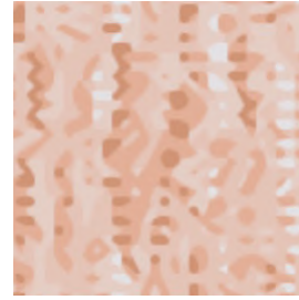
RE51049 マイデザイン作品 ID : MO-7VVY-KFPC-9BJF

モチーフは革の「しわ」。革製品を作る際に使われずに省かれることも少なくありません。そんなしわもスケールを変えることで、魅力的なパターンへと生まれ変わります。