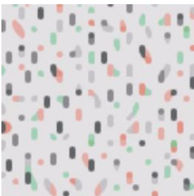
RE51061 マイデザイン作品 ID MO-G5KR-JP99-V16J

モチーフは「雨」。突然降り始めた雨、仕事帰りの雨。雨音や人混みの喧騒によってネガティブに感じる雨も周辺の景色や車のライトや街灯を写し込んだ光の粒はとても魅力的です。