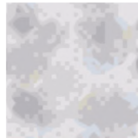
RE51058 マイデザイン作品 ID : MO-D7XN-2102-F73H

モチーフは「滲み」。意図せず生まれた滲みのグラデーションも魅力的で、一面に滲みを作ってみました。壁に墨が浸透していくような繊細な表情を、色のグラデーションを吟味し表現したデザインです。