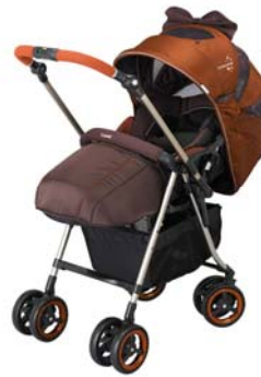
ディアクラッセ オート4キヤス エッグショック

コンビ株式会社は、大好評発売中の「振動レスシステム」を搭載したベビーカー「メチャカル ファースト α エッグショック」(8月下旬発売)及び「ディアクラッセ オート4キヤス エッグショック」(10月中旬発売)が、発売後4ヶ月間で過去最高の出荷台数を記録し※1、11月単月では2011年対比270%を達成致しました。また、この販売好調を受け、「ディアクラッセ オート4キヤス エッグショック YB-500」に、2013年2月下旬より「ミストブラック」及び「ブライトレッド」の2色をシリーズに追加し販売します。