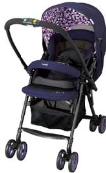
メチャカル ファースト α エッグショック

日本初！振動によるストレスから赤ちゃんを守る「振動レスシステム」搭載ベビーカー 発売後4カ月間で過去最高の出荷台数を記録し、“振動レスママ”が急増中！？ 販売好調につき、「ディアクラッセ オート4キヤス エッグショック YB-500」に新色追加