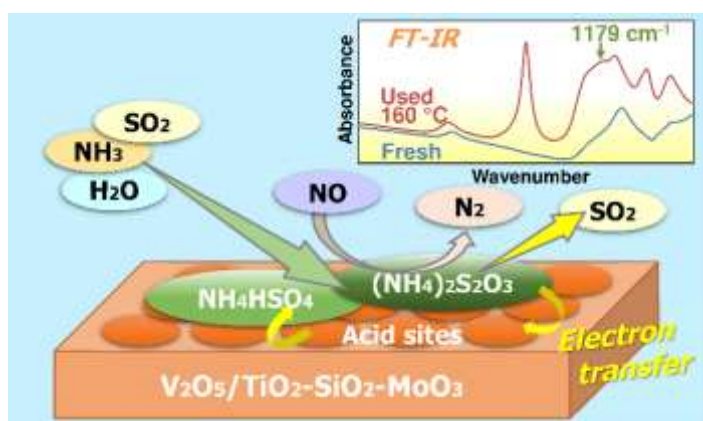
図 2 触媒上での硫酸アンモニウム塩分解モデル

当社では引き続き脱硝触媒の改良研究に取り組んでおり、得られた知見の活用により更なる高活性・高耐久性触媒の開発を目指しております。性能向上により、必要触媒量の低減による経済的効果だけでなく、排ガス処理温度の更なる低温化による再加熱エネルギー削減、つまり CO 2 削減へ繋がると期待されます。日本触媒は企業理念「TechnoAmenity—私たちはテクノロジーをもって人と社会に豊かさと快適さを提供します」の下、優れた触媒技術の開発を通じて、地球環境の保全に貢献していきます。