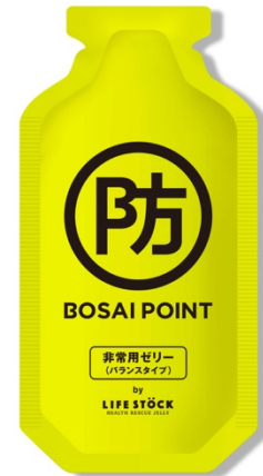
BOSAI POINT 非常用ゼリー

コンパクトサイズに収納できて、もしもの時に役立つ BOSAI POINT 非常用ゼリー、BOSAI POINT オリジナル防災グッズや、“食べることが支援になる”をコンセプトとした BOSAI POINT オリジナルラーメンが購入できます。BOSAI POINT 非常用ゼリーは、電気・水・ガスがなくても食べられる、世界初 5 年間保管可能なゼリーです。10 年前の東日本大震災の直後、水が不足して、口に入れると喉が渇いてしまう保存食を配布できなかった自治体もありました。ゼリーにすることで、水や電気がない状況でも美味しく食べられ、乳幼児や介護を必要とする方もお召しあがりやすくなります。実際の震災の体験を元に株式会社ワンテーブルが開発した「LIFESTOCK」を BOSAI POINT オリジナルパッケージでお届けします。