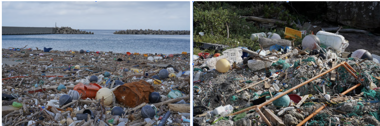
【資料】長崎県対馬の海岸に漂着したゴミ

島の形状、潮流などの影響で大量の漂着物が打ち寄せられる、「海ごみの防波堤」ともいわれる長崎県の対馬。その漂着量は年間約2万～3万㎡、事業費は約2億8千万円に上るといわれています。