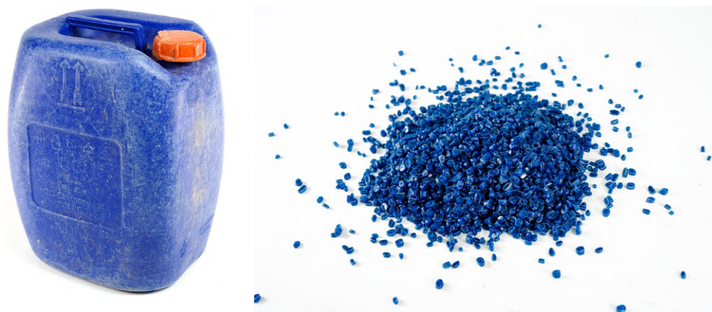
【資料】写真左：青いポリタンク、写真右：青いポリタンクを洗浄等の行程を経てペレット化したもの

強度面で不安があるとされてきたリサイクル素材を使っても、安心して長く使える製品です。