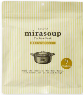
香るスパイスジンジャー

■まとめBOX (3袋セット) 価格：7,120円 (税込) ※通常より5%OFF+送料無料