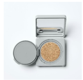
02 Natural Beige イエロートーンの 健康的なベージュ