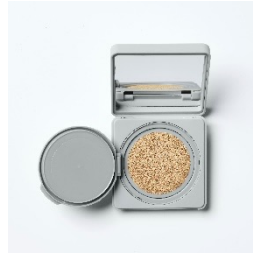
01 Light Beige イエロートーンの 明るめのベージュ

『UUUNI (ウーニ)』 商品名：BrightUp Skin Foundation 価格：3,850円（税込） 種類：：01 Light Beige/02 Natural Beige SPF50+・PA+++