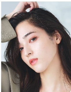
#01 Light Beige

イエロートーンの明るめのベージュである「#01 Light Beige」と、イエロートーンの健康的なベージュである「#02 Natural Beige」の2色をラインナップいたします。