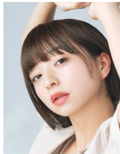
#02 Natural Beige