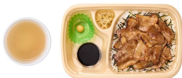
[テイクアウト] 三元豚まぶし だし付 930 円