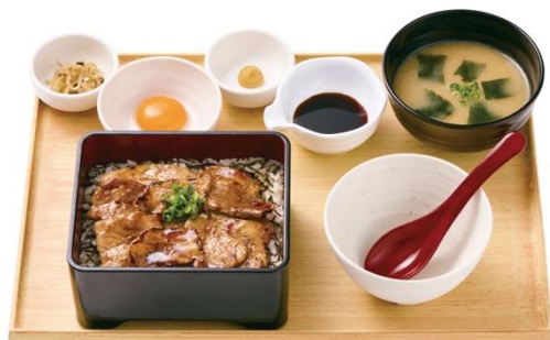
三元豚まぶし定食 990 円