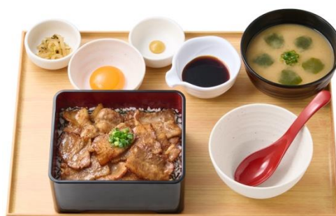
【お肉 2 倍】三元豚まぶし定食 1,590 円