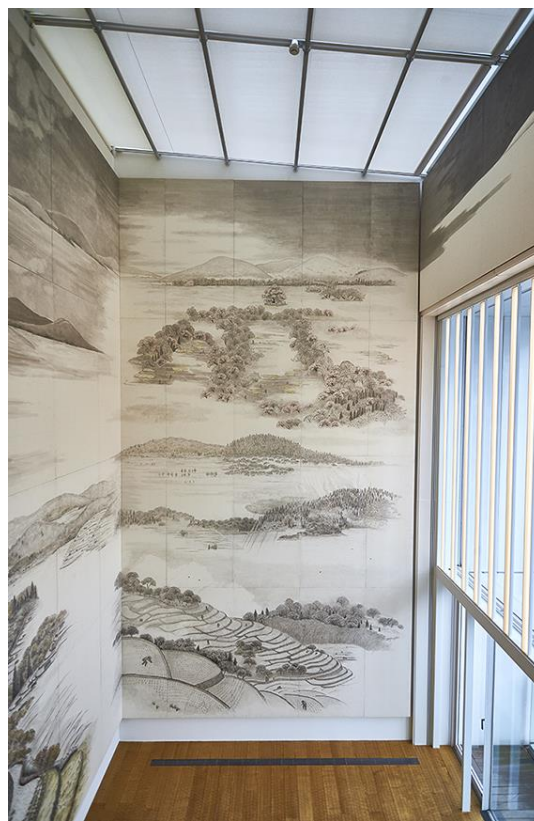
壁画「棚田の四季」 プレナス茅場町オフィス7階

当イベントにご来場のうえ、アンケートへご協力いただいた方の中から抽選で10名様に、「ほっともっとお食事券500円分」をプレゼントいたします。