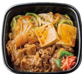
丼タイプ 牛すき重 620円