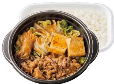
鍋タイプ 牛すき焼き弁当 720円