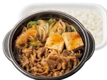
鍋タイプ W牛すき焼き弁当(肉2倍) 980円