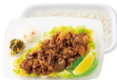
～キャベツたっぷり～ W ビーフレモン弁当(肉 2 倍) 960 円