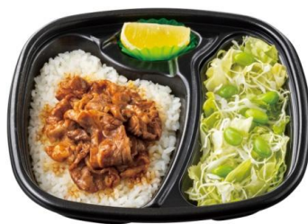
セットでうれしい！ サラダ&ビーフレモンコンボ 630 円