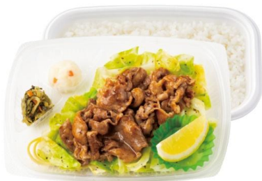
～キャベツたっぷり～ ビーフレモン弁当 630 円