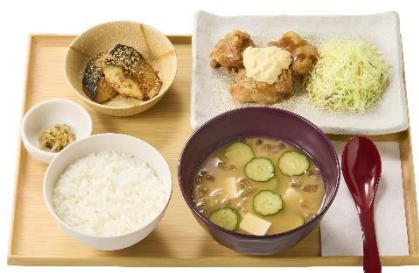
冷汁ととり南蛮の定食 990 円