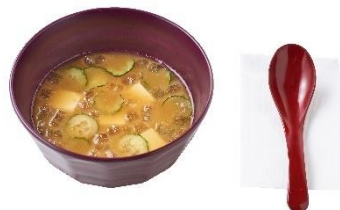
冷汁(単品) 290 円