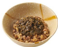
アカモク納豆 250 円