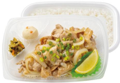
～レモンが決め手！～ 旨塩豚カルビ弁当 600 円