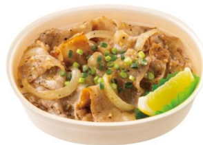
～もち麦ごはんのミニ弁当～ もちミニ 旨塩豚カルビ弁当 540 円