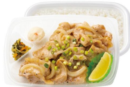
～レモンが決め手！～ W 旨塩豚カルビ弁当(肉 2 倍) 890 円