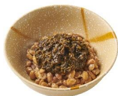
アカモク納豆 250 円