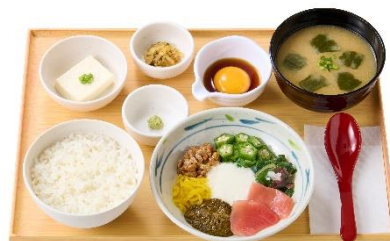
【アカモク入】ねばとろ定食 860 円