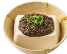
アカモク冷奴 250 円