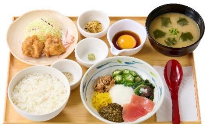
【アカモク入】ねばとろとから揚げの定食 990 円