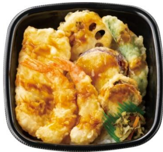
エビ 2 尾/イカ/ホタテ/野菜 3 種 海鮮天丼 590 円

また、天丼のたれは地域の味の好みに合わせ、東日本は 2 種の醤油と風味の異なる 2 つの鰹節を効かせ、すっきりとした味付けとキレのある風味となっております。西日本は鰹と昆布、煮干し、椎茸の旨みに濃口醤油を合わせ、まろやかな甘味を感じるたれに仕立てました。