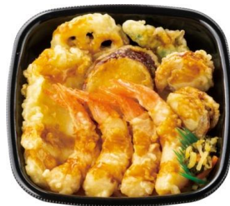
エビ 4 尾/イカ/ホタテ 2 コ/野菜 3 種 上・海鮮天丼 780 円