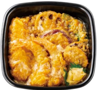
エビ 2 尾/イカ/ホタテ/野菜 3 種 海鮮天とじ丼 650 円