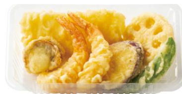
エビ 2 尾/イカ/ホタテ/野菜 3 種 天ぷら盛り合わせ 490 円