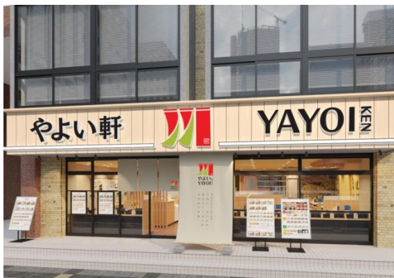
やよい軒錦糸町北口店 外観イメージ