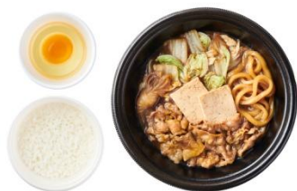
[テイクアウト] すき焼き ごはん・生たまご付 900 円