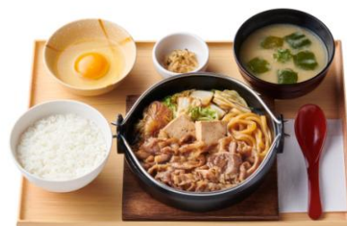
肉増・すき焼き定食 1,390 円