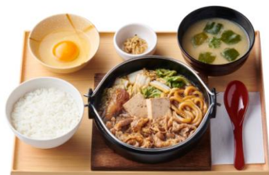
すき焼き定食 950 円

“えらべる冬鍋”は第二弾も発売予定です。お好みの味わいが選べる、体の芯から温まる冬鍋シリーズをぜひお楽しみください。