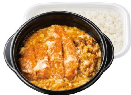
とんかつ・エビフライ・牛肉の たまごたっぷりミックスとじ弁当 690 円