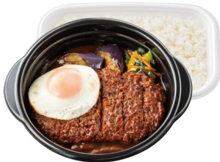
しみうま濃厚 味噌かつ煮弁当 650 円

1 食に対して卵を贅沢に 2 個使用し、ボリュームのある具材をふんわり包み込みました。だしが効いた甘めの醤油だれと相まって、優しいながらもごはんがすすむ味わいです。