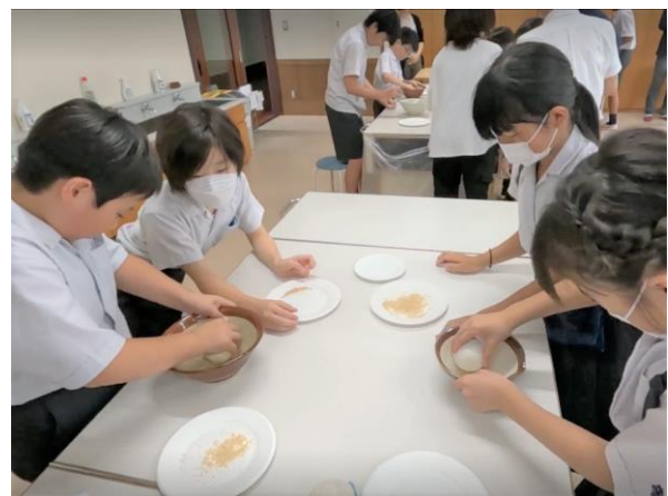
9月22日 野球ボールを使用して、粃摺り