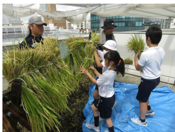
9月 稲刈り後「はざかけ」