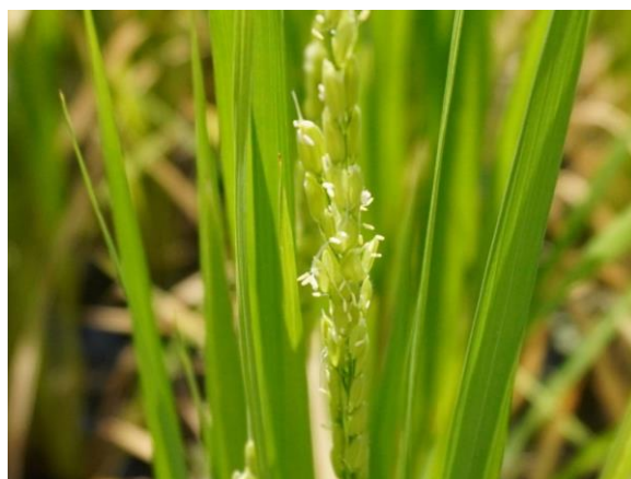
8月 美しい白い花が開花