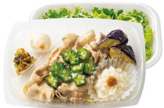
梅おろし豚しゃぶサラダ 620 円