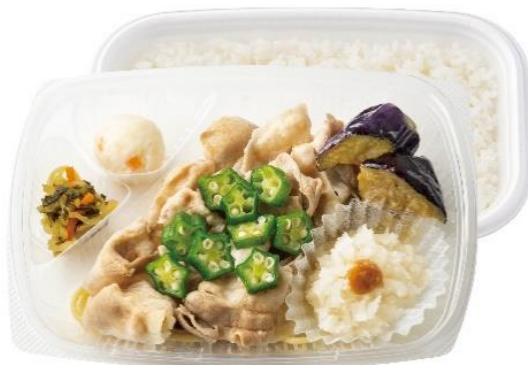
梅おろし豚しゃぶ弁当 590 円

梅雨の蒸し暑くなる時期にぴったりの、紀州南高梅と大根おろしで爽やかな味わいに仕上げた商品です。野菜もしっかり食べたいという方におすすめの、1日に必要な野菜の1/3を摂れる※1『梅おろし豚しゃぶサラダ』も販売しております。食欲が減退しやすい季節にも、梅が香るさっぱりとした味付けで美味しくお召し上がりいただけます。