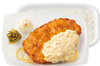
チキン南蛮弁当 550円