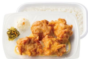
から揚げ弁当 (4コ入り) 450円