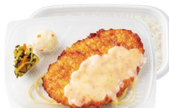
九州チキン南蛮弁当 550円