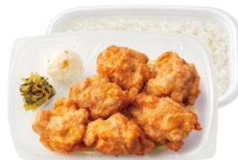
特から揚げ弁当 (6コ入り) 560円