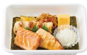
銀鮭ハラスの塩焼き BOX 590 円