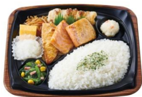
銀鮭ハラスの塩焼きプレート 810 円