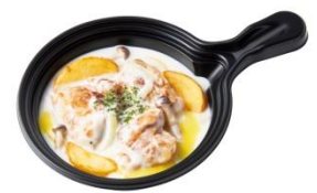
グリルチキンの ホワイトソース煮込み(ハーフ) 460円