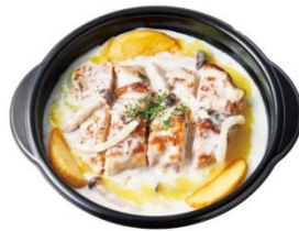
ワイルドチキンの ホワイトソース煮込み(単品) 760円