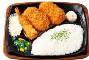
カニクリームコロッケ& えびフライプレート 720円