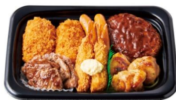
ファミリー洋食プレート 1,890円