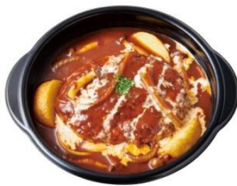
グリルハンバーグの デミソース煮込み(単品) 760円

また、今年は『ワイルドチキンのホワイトソース煮込み』も新たにラインナップ。食べ応えのあるチキンに、濃厚で甘みのあるクリームソースをたっぷりかけてオーブンで煮込み、アクセントとしてガーリックバターソースを加えて仕上げました。寒い季節に2種の贅沢煮込みメニューをお楽しみください。また、いつものお弁当にプラスして手軽にお楽しみいただける、-halfサイズもご用意しております。