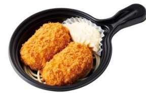
プラスカニクリームコロッケ (2ヶ) 450円