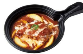
グリルハンバーグの デミソース煮込み(ハーフ) 460円