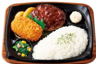
カニクリームコロッケ& グリルハンバーグ(デミ)プレート 820円

カニクリームコロッケは、なめらかでくちどけの良いベシャメルソースと国産紅ズワイガニの身を使用しており、サクとした衣の中に、とろとしたカニクリームがたっぷり入った一品です。人気のハンバーグとの組み合わせが贅沢な『カニクリームコロッケ&グリルハンバーグ(デミ)プレート』や、たっぷりカニクリームコロッケが味わえる『カニクリームコロッケ&えびフライプレート』のほか、これからのパーティーシーズンにも活躍する人気メニューを盛り合わせた『ファミリー洋食プレート』も登場します。