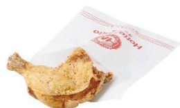
骨付きフライドチキン 330円