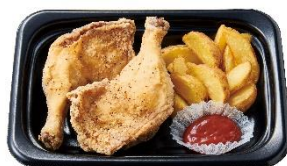
骨付きフライドチキン(2ヶ) &ポテトプレート 700円