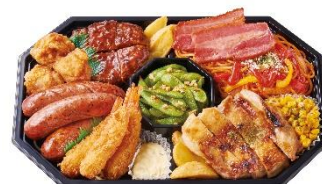
グリルオードブル 3,000円