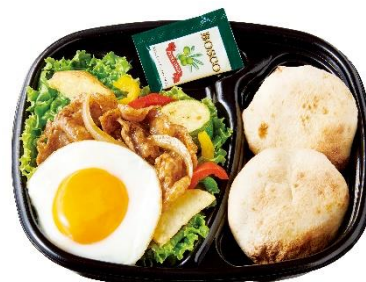
カルビ焼肉サラダ (パンセット) 590 円