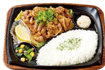
Wビーフレモンプレート 790 円