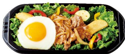
カルビ焼肉サラダ 490 円