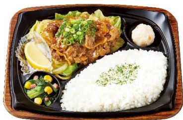
ビーフレモンプレート 590 円