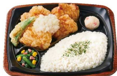
おろしとり天プレート 540円

『おろしとり天プレート』は、とり天を4個盛りつけた食べ応えのある商品です。とり天は下味をつけた鶏もも肉を、店内でひとつひとつ衣をつけて揚げています。鶏肉の旨みを存分に味わえるよう仕立てました。大根おろしをのせ、ゆず・すだち・かぼす・だいたい・レモンの5種の柑橘果汁を使用した“和風ぼん酢”をかけていただくことで、ジューシーなとり天をさっぱり美味しくお召し上がりいただけます。