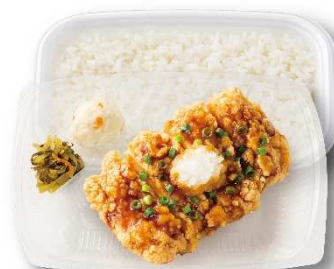
おろしチキン竜田弁当（香味醤油／和風ぼん酢） 490円