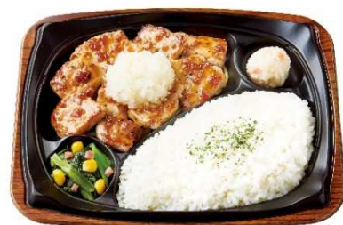
おろしポークステーキプレート 790円

「ほっともっとグリル」初となる、“ポークステーキ”が登場です。ポークステーキは食欲が落ちやすい時期も美味しく召し上がっていただけるよう、脂身が少なくあっさりとした味わいが特長の豚もも肉を採用し、玉葱の旨味を加えた肉によく合う和風ソースを絡めました。そのままでも美味しく味わえますが、大根おろしと合わせていただくとさっぱりとお召し上がりいただけます。また、お好みで別添のだし醤油をかけて、味の変化をお楽しみください。