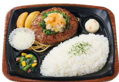
グリルハンバーグプレート（おろしぼん酢） 670円※1