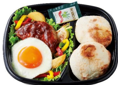
ロコモコ風サラダ (パンセット) 590円

サラダの上に、デミグラスソースをかけた1/2カットのハンバーグ、ウェッジカットポテト、目玉焼きを盛り付けた商品です。ハンバーグや野菜をパンに挟んで、ハンバーガーのようにお召し上がりいただくのもおすすめです。チーズ、アンチョビ、ガーリックの風味を効かせた、クリーミーでコクのある別添のシーザーサラダドレッシングをかけてお楽しみください。