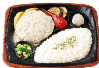
～2種のグリル野菜添え～ グリルハンバーグプレート (マスタードクリームソース) 790円