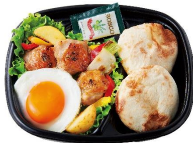
Grillチキンのパイザヌサラダ (パンセット) 590円