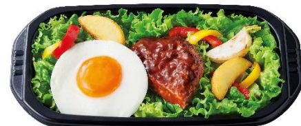
ロコモコ風サラダ 490円