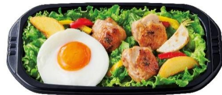
Grillチキンのパイザヌサラダ 490円