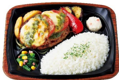
～2種のグリル野菜添え～ グリルハンバーグプレート (焼きカプレーゼ) 890円