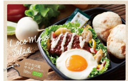
サラダとパンの美味しいセット

パイザヌサラダは、直訳すると“田舎風サラダ”という意味で、フランスで古くから愛されてきた、主に野菜や玉子を使用する定番サラダです。サラダの上に、オーブンで焼いた鶏もも肉の Grillチキンを3個、ウェッジカットポテト、目玉焼きを盛り付けました。別添のパイザヌサラダドレッシングは、玉子のコクと旨味が効いたまろやかなドレッシングに、ハーブやマスタードを加えた、奥深い味わいです。