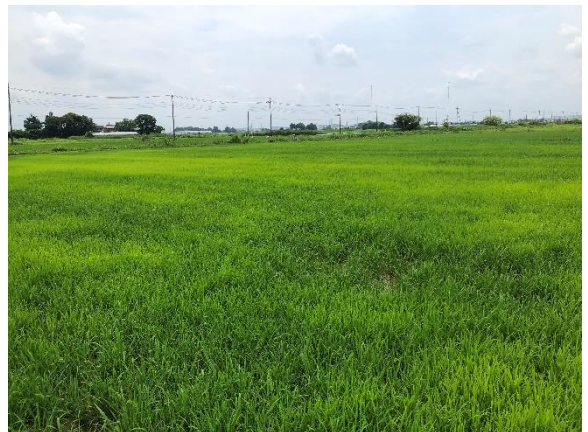
直播田んぼの様子 (6月24日)