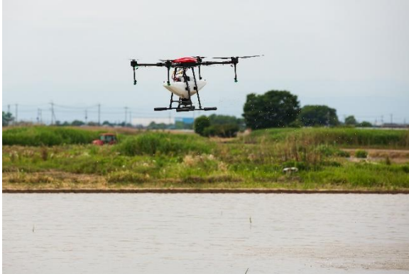
ドローン田植えの様子 (5月12日)