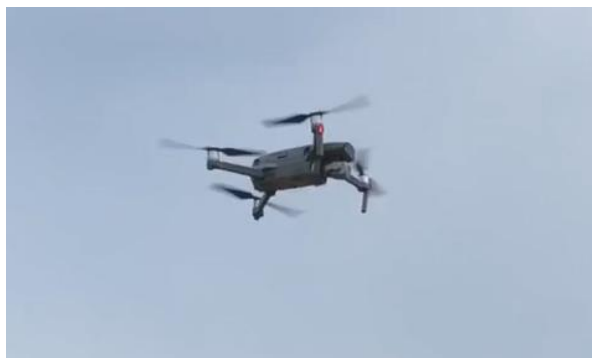
水田を撮影するドローン

プレナスでは、これからもお客様の満足と健康を実現し、人びとに笑顔と感動をお届けし続けることができるよう邁進してまいります。