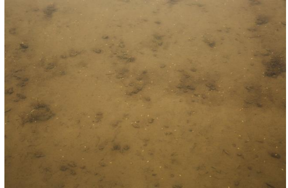
直播後の田んぼ (5月12日)