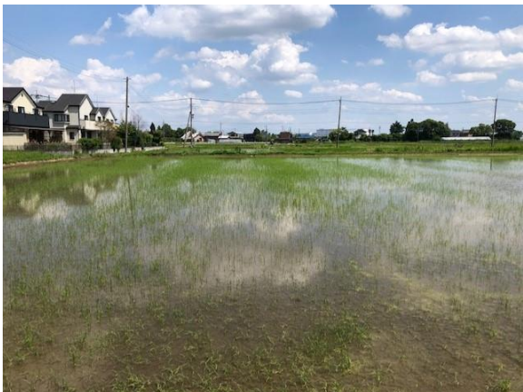
直播田んぼの様子 (5月30日)