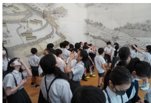
巨大壁画「棚田の四季」の観覧