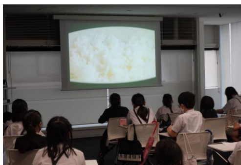
米文化継承番組「The Story of Rice」を視聴