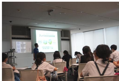
お米について学習