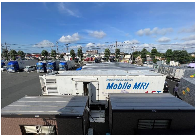
（左）129号相模原SS近隣に設置したMRI搭載車両

現在、東日本地域で約240カ所のSSを運営する東日本宇佐美と協働し、トラック物流関連企業が集積する神奈川県内の2カ所で開催しています。7月25日（月）から8月14日（日）まで129号相模原サービスステーションで実施、これに続き、今回は東扇島サービスステーションでの提供となります。