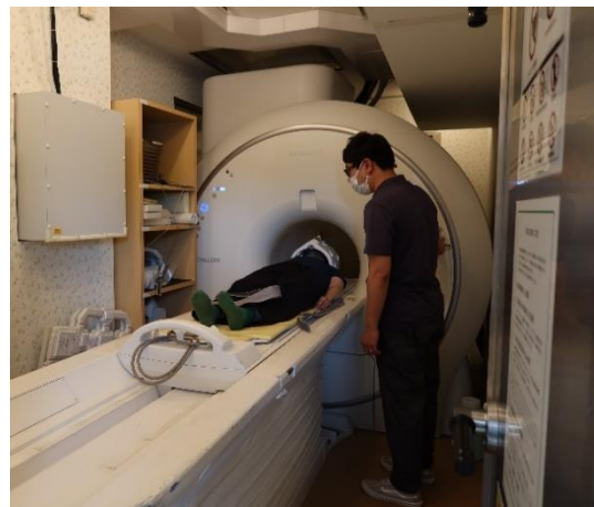
（右）車両内での健診イメージ

運送業に従事するドライバーは、他の業種と比較すると脳や心臓に疾患をもつ傾向が高いことが知られています（*1）。日頃からSSを頻繁に利用するトラックドライバーや近隣にお住まいの方々に、脳健診の受診機会を創出することで、SSが地域のお客様の健康維持に貢献し、豊かな暮らしを支える拠点としての新たな価値を発揮することを目指します。