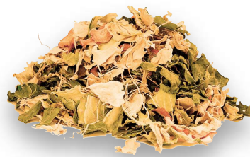
乾燥処理後の生ごみ

乾燥処理した生ごみは枯葉のようにパリパリになり、 重量は約1/5まで軽くなります。 腐敗しないため、臭い、コバエ、雑菌の繁殖もせず、 室内に本当の清潔さを取り戻すことができます。 部屋の中でのごみの長期保管も容易となり、 ごみ出しの際も、臭いも重さも汁だれも気になりません。