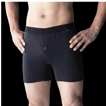
消臭ニットランクス(涼感)

夏の足のニオイへの多くのお悩みにお応えし、スピード消臭機能を持ったフットケア商品。レギュラータイプと浅履きタイプの2種類をご用意し、様々なパンプスにマッチします。