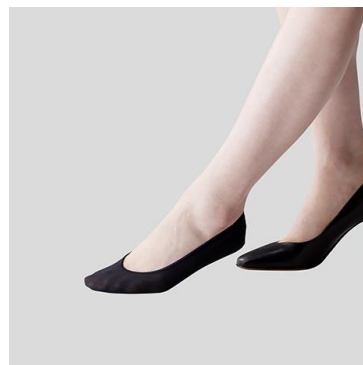
消臭フットカバー (レギュラータイプ)