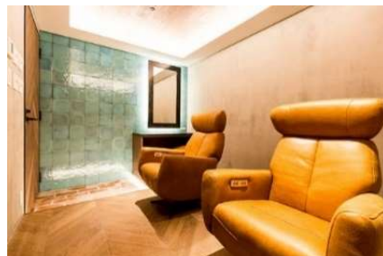
施術室（ペアルーム）