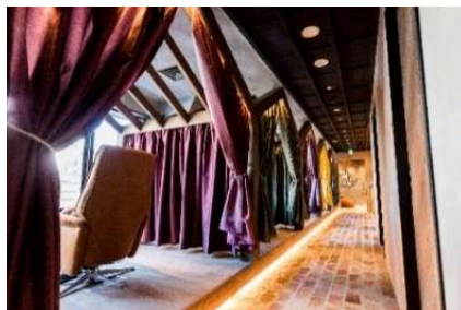
施術室（シングルブース）