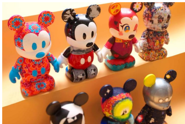
▲バイナルメーション展示イメージ