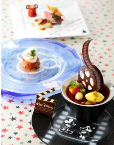
▲「エンパイア・グリル」(ディナーコース)