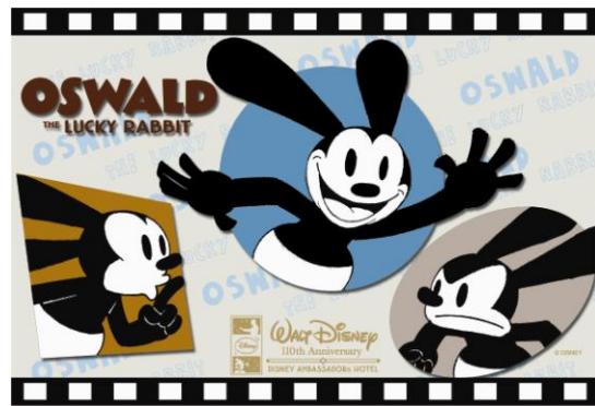
▲ウォルト・ディズニー生誕110周年記念 期間限定ポストカード