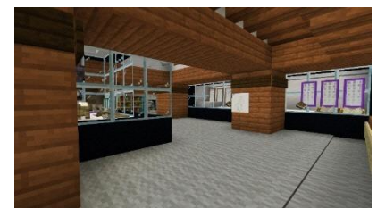
福知山城天守閣 2 階 展示