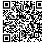
↑ アンケートフォーム