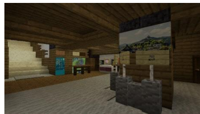
福知山城天守閣 地階 受付