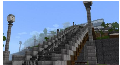
福知山城前の橋(昇龍橋)