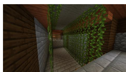
福知山城天守閣 アスレチック ※大学生が考案