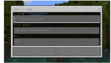
↑ Windows10 版の画面