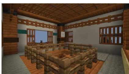
福知山城天守閣 展望室