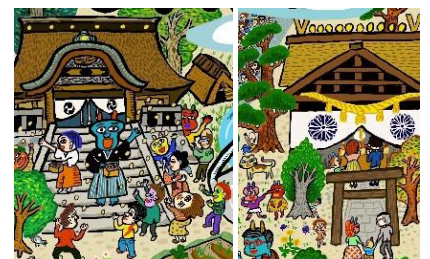
左:大原神社 右:元伊勢内宮 ONiversal city project キービジュアルより

大江山以外の地域にもユニークな鬼文化が残ります。福知山市三和地域の「大原神社」の節分祭のかけ声は「鬼は内、福は外」。巷にある悪いものを神社で清めたいうで(=鬼は内)、村に福をお返しする(=福は外)一風変わった節分祭。鬼がお多福に変わる演出は地元の有志により演じられ、今もなお地域のひとたちに愛されている恒例行事です。