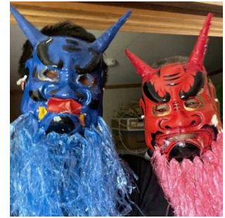
写真)鬼の応援隊のお面例 (大原話し合いの会 提供)