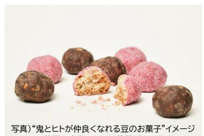
写真)「鬼とヒトが仲良くなれる豆のお菓子」イメージ ※仕様は変更となる可能性があります

来たる節分シーズンに向け、“鬼のまち”福知山市は市内外の多くのヒトの協力のもと、『ONiversal city project』をより一層盛り上げていきます。