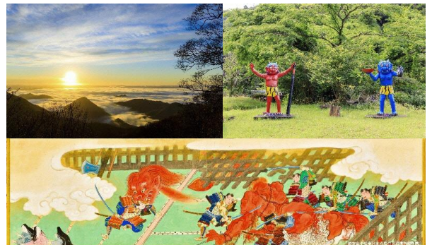
左上:大江山の雲海 右上:鬼像 下:「酒吞童子絵巻」日本の鬼の博物館所

■「鬼の聖地」大江山に伝わる最強の鬼・酒吞童子の伝説 福知山市にある大江山には、平安時代中期の武将「源頼光(みなもと よりみつ/らいこう)」が、「頼光四天王」と呼ばれる屈強な家臣らを従え丹波国大江山へ向かい、酒吞童子(しゅてんどうじ)率いる鬼の一味を討伐(鬼退治)するという伝説が伝わっています。大江山は2007年に「丹後天橋立大江山国立公園」に指定。毎秋、酒吞童子伝説と大江山をテーマとした「大江山酒吞童子祭り」が開催されています。※2023年 第42回は台風7号災害のため中止