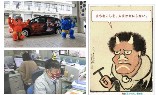
左上:鬼タク特別仕様車 左下:市役所大江支所の様子 下:「鬼伝説のまち、福知山」ポスター

■昭和から令和まで、市としての「鬼のまちづくり」の取り組み 昭和以降、大江山の鬼伝説がまちおこしに使われるようになりました。大江駅前では72体の鬼瓦がお出迎えし、大江山までの道中には13体の鬼像が佇むなど、様々な場所に自然と鬼が共存しています。令和になった今も、福知山市は鬼伝説をモチーフにしたPR動画やポスター、鬼ラッピングのタクシーなど、様々な鬼コンテンツを企画し、「鬼のまちづくり」をすすめています。 コロナ禍では「鬼鬼の日」の市役所大江支所職員や地域で働く人々の鬼のコスプレ姿が一躍話題に。“鬼のまち”をポップに楽しくアピールしようと、すすんで鬼マスクや角を装着し、そのシュールな姿にメディアの注目を集めることとなりました。