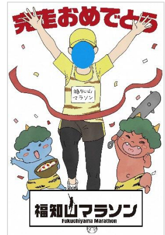
写真)顔ハメパネルイメージ