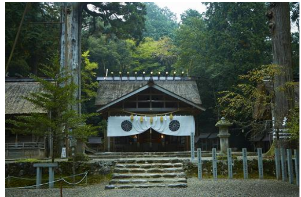
元伊勢内宮皇大神社