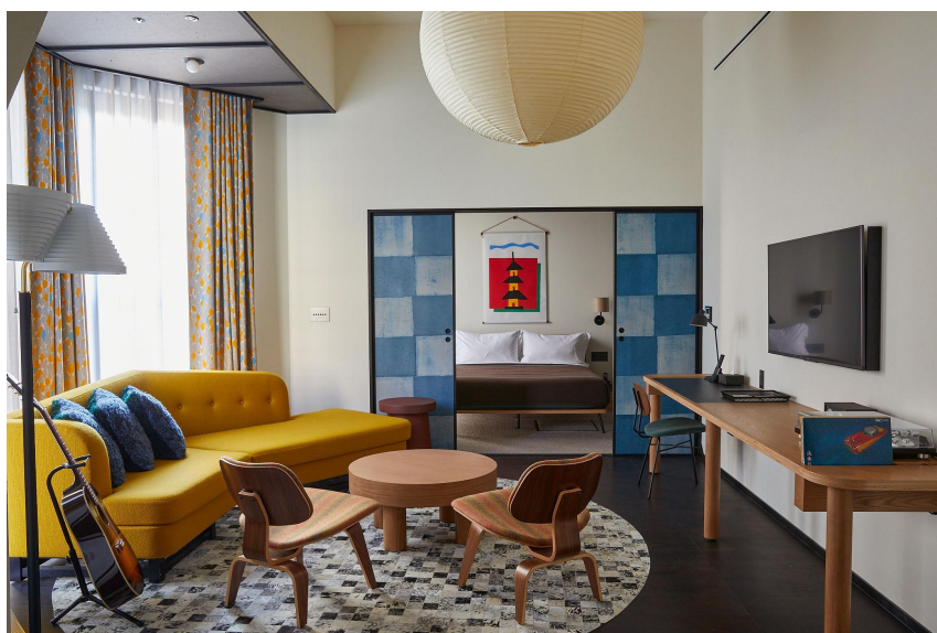
客室: エーススイート