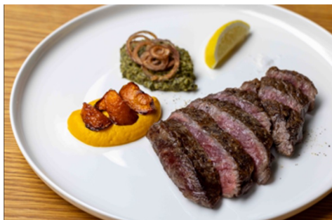
熊本牛サーロインステーキ、根菜、 サルサヴェルデポテト、柑橘のグリル 4,800円