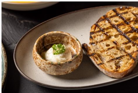
天然酵母のカンパーニュ、 自家製あおさのりバター、海塩 800円