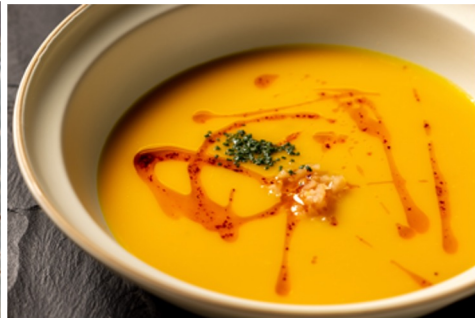
スモーキーパンプキンポタージュ、 新生姜のピクルス、チャイブ、ピマンデスペレット、 天然酵母のカンパーニュ 1,600円