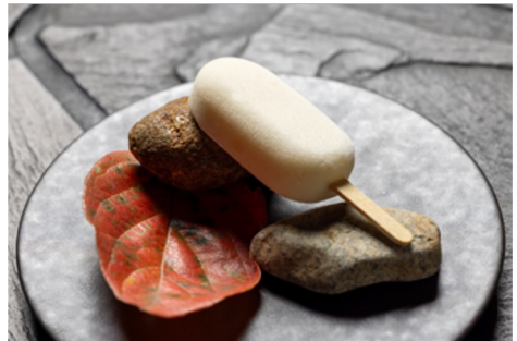
信濃スイート林檎のロースト、シナモンシュトロイゼル、 焦しバターアイスクリーム 1,400円 ※画像はイメージ

アメリカ出身のケイティが監修するKŌSAでは、国内農家で採れたばかりの野菜を贅沢に調理したFarm To Tableファーム・トゥ・テーブルの料理を提供します。ファーム・トゥ・テーブルとは、直訳の農家からテーブルへの意味の通り、レストランで提供する食材は主に農家や生産者から直接買い付けた旬の野菜・肉・魚・穀類を使用するカリフォルニアの精神になります。