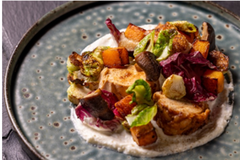
本日の収穫野菜、カシューナッツのソースと 葉人参のペスト 1,800円