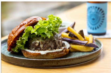
KŌSA国産牛バーガー、虹色フライ、 ケールシーザーサラダ 3,200円