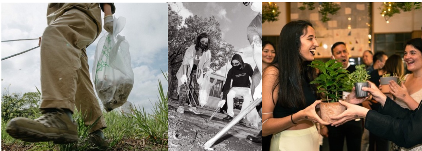
昨年のゴミ拾いの様子