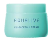
エッセンスフルクリーム